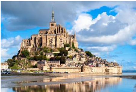
Mont Saint-Michel (Normandie)