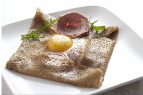
Crêpes bretonnes au sarrasin