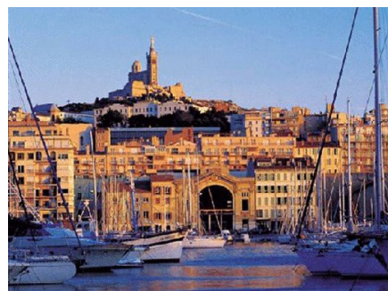
Le Vieux-port (Marseille)