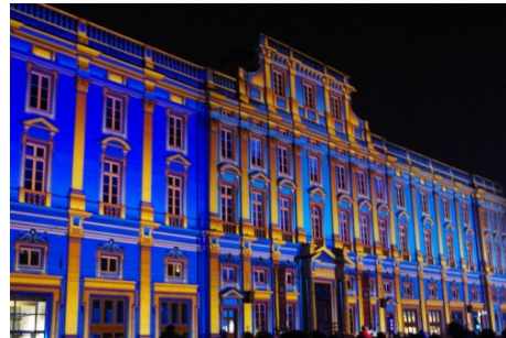
Musée des beaux-arts (Lyon)