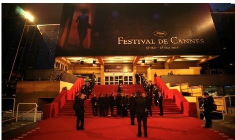
festival de Canne (Canne)